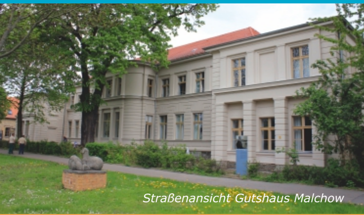
Straßenansicht Gutshaus Malchow

Hauptsitz Aufnahmebüro STIFTUNG SYNANON Dorfstraße 9 | 13051 Berlin-Lichtenberg, OT Malchow