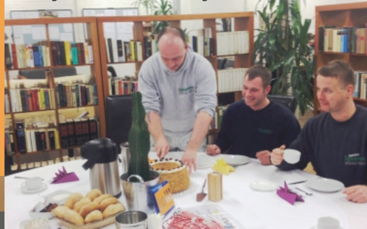
Wird gefeiert: Clean-Geburtstag

Synanon ist eine Suchtselbsthilfegemeinschaft , die im Jahre 1971 von Betroffenen für Betroffene gegründet wurde. Nach unserer Überzeugung trägt jeder suchtmittelabhängige Mensch die Fähigkeit in sich, wieder ein drogenfreies Leben zu führen, wenn ihm der geeignete Rahmen dafür geboten wird.