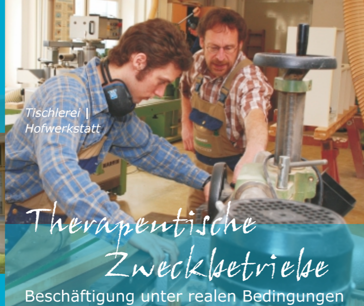
Tischlerei | Hofwerkstatt