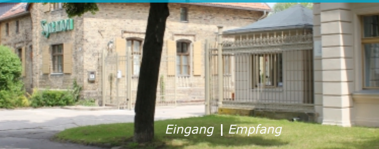
Eingang | Empfang

Hauptsitz Aufnahmebüro STIFTUNG SYNANON Dorfstraße 9 | 13051 Berlin-Lichtenberg, OT Malchow