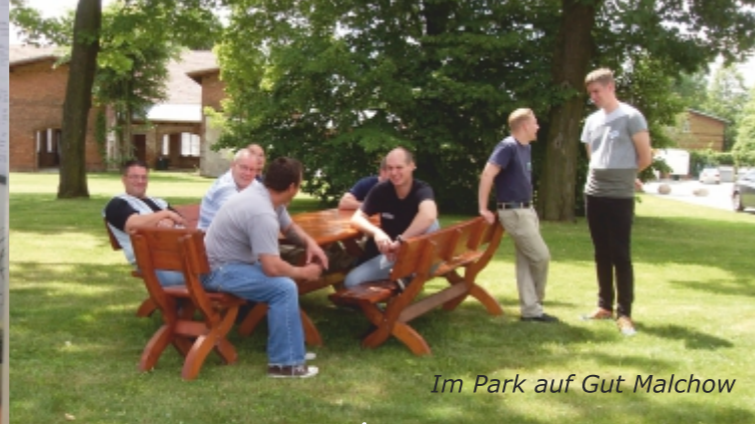
Im Park auf Gut Malchow